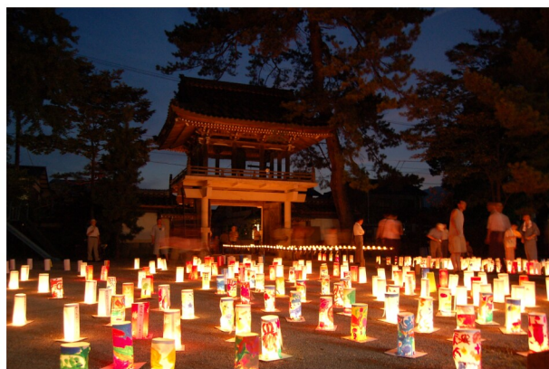
境内に並べられた約八百の灯籠