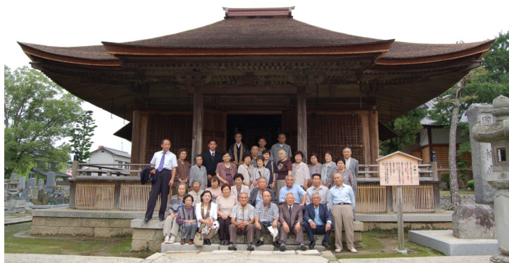
国重要文化財 妙源寺 柳堂にて

三河では、蓮如聖人ゆかりのお寺三ヶ寺に参拝いたしました。NHKの連続テレビ小説「純情きらり」で有名になった八丁味噌工場、さかな市場、酒の文化館、えびせんの里なども見学しました。吉良温泉の夕食は、カラオケで歌を披露する方もあり、楽しい団体参拝でした。