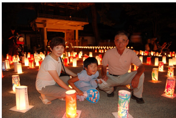
参詣者 (誓念寺境内にて)