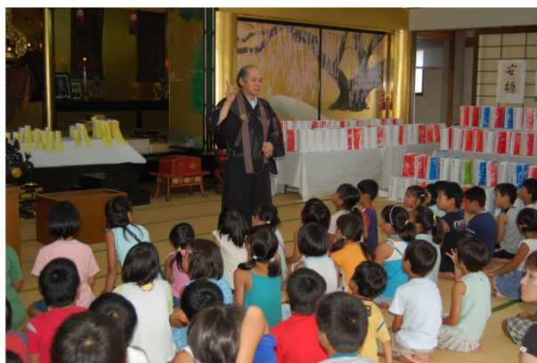
住職の法話を聞く小学生

お盆に先立ち八月十二日、子どもの集いが開かれ、小学生の多数が参加しました。仏歌、法話のあと、お経をもとにしたパネルシアター「小鬼の贈り物」を楽しみ、マジックショーがありました。輪投げ、射的などのゲームを楽しみ、カレーライスで会食をして終わりました。