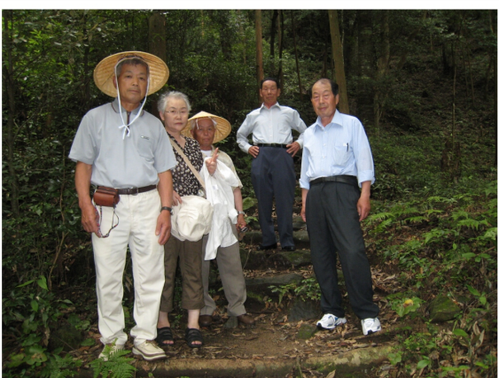
(世界遺産 熊野古道)